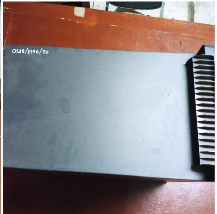
๑๐.เครื่องคอมพิวเตอร์ ยี่ห้อ HP รุ่น Compaq ๘๑๐๐ Elite